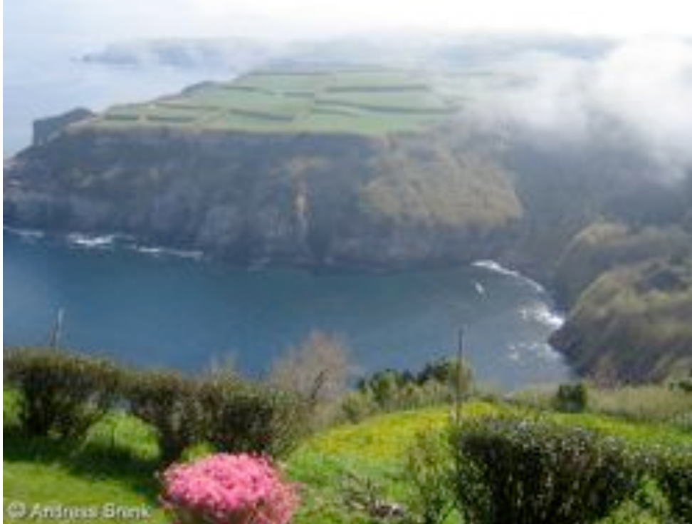
Hier kann man den Blick schweifen lassen: die typisch-malerische Steilküste im Norden von Sao Miguel